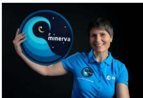
Astronautka agentury ESA Samantha Cristoforetti.

Posádka bude na palubě Mezinárodní vesmírné stanice mimo jiné řešit i řadu vědeckých úkolů, jedním z nichž bude studie bezdrátové komunikace v rámci projektu agentury ESA Compose-2. Ten má demonstrovat možnosti bezdrátových sítí pro podporu vědeckých experimentů a zajištění přesného řízení a navigace volně letících objektů.