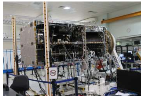
Družice Sentinel-1C v poslední fázi testování.

Agentura ESA uzavřela jménem Evropské komise smlouvu s firmou Arianespace na vynesení družice Sentinel-1C programu Copernicus na oběžnou dráhu. Copernicus je program pro dálkový průzkum Země koordinovaný a řízený Evropskou unií, konkrétně Evropskou komisí, ve spolupráci s agenturou ESA. Zaměřuje se na pozorování atmosféry, pevniny, moří a klimatu. Je využíván i v oblasti bezpečnost a poskytuje podporu záchranným operacím v případě katastrof a havárií. Družice Sentinel-1C bude na oběžnou dráhu vynesena v první polovině roku 2023 evropskou raketou Vega-C z kosmodromu Kourou ve Francouzské Guyaně.