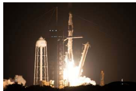
Start rakety Falcon 9, jež k Mezinárodní vesmírné stanici vynesla vesmírnou loď Crew Dragon s posádkou Crew-4.

Čtyři astronauti, společně známí jako Crew-4, odletěli ve středu 27. dubna 09:52 SELČ z Kennedyho vesmírného střediska NASA na Floridě v USA a stráví ve vesmíru téměř půl roku. Na Mezinárodní vesmírnou stanici posádku přepravila vesmírná loď Crew Dragon společnosti SpaceX po zhruba 16 hodinách letu.