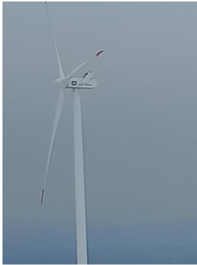
Obr. č. 8